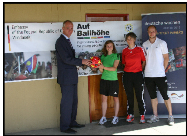
Materialübergabe in Windhuk

Die deutschsprachige Allgemeine Zeitung (AZ) veröffentlichte zwei Artikel. Der erste Bericht wurde nach der offiziellen Übergabe der Sportgerätespende der Deutschen Botschaft Windhuk veröffentlicht. Der zweite Artikel wurde nach Ende des Programms durch das große Turnier als kleines Resumé des Projekts 2015 gedruckt.