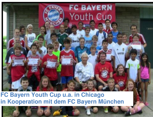
FC Bayern Youth Cup u.a. in Chicago in Kooperation mit dem FC Bayern München

Seit 2011 bieten wir in Kooperation mit der „Deutschen Botschaft in Washington“ und Concordia Language Village jährlich das mehrmonatige Projekt: » Do Deutsch – Get a Kick Out of It « in den USA an. Dazu entsendet „Auf Ballhöhe“ speziell vorbereitete junge Trainer sowohl an Schulen, als auch in Jugend-Camps zur Vermittlung der deutschen Sprache und Kultur.