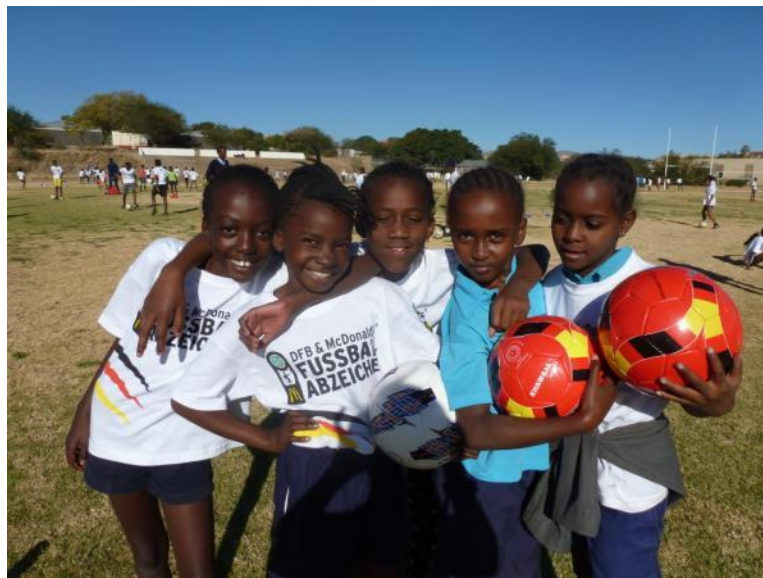
Trainingscamp 2015, Windhuk

Mit relativ geringen Mitteln wurden viele Kinder und Erwachsene erreicht, die nun mit den überreichten Materialien als Multiplikatoren wirken können. Somit kann die Reichweite noch vergrößert und die Arbeit fortgesetzt werden.