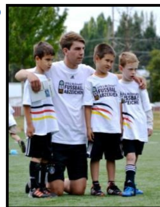
Fußballcamp in Portland