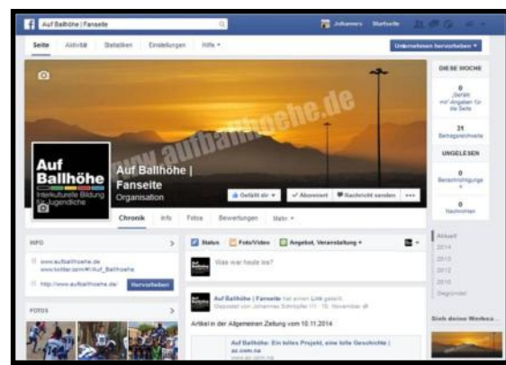
Facebook-Seite von Auf Ballhöhe

Auf der Facebookseite Auf Ballhöhe | Fansite wurde über das Projekt 2015 täglich ein Blog veröffentlicht. 15 Einträge wurden gepostet, die im Schnitt 717 Personen erreichten. In der Spitze wurden mit einem Eintrag 2600 Personen erreicht (Stand 28.08.2015). Weiterhin wurden auf der Fansite 100 Fotos veröffentlicht. Auf der Seite der Deutschen Botschaft Windhuk wurden ebenfalls Beiträge mit Fotos über das Projekt eingestellt.